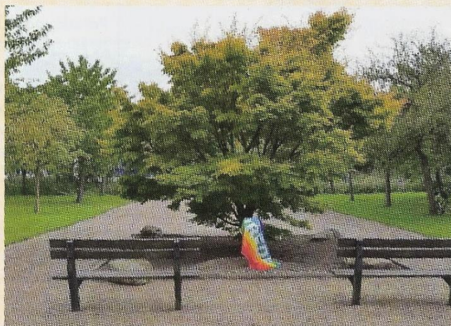
Herdenkingsmonument Hiroshima in het Rosarium van het voormalig Holy-ziekenhuis.

Vermeld je naam en adres bij storting van je bijdrage.